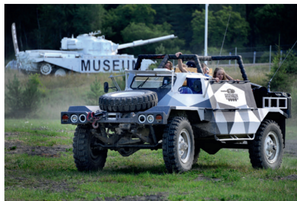
Många av museerna anordnar evenemang och aktiviteter för hela familjen. Arsenalen, Strängnäs.