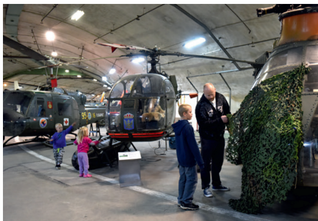
Besök SMHA-museerna med hela familjen. Aerozeum, Göteborg.

Att öka kunskapen om det svenska försvaret genom tiderna och om dess roll i samhällsutvecklingen är SFHM:s uppdrag. Det innebär att myndigheten ska se till att alla som vill, ska kunna lära sig mer om Sveriges försvar. Både i äldre tider och idag. SFHM ska också berätta om hur krig påverkar, och har påverkat, människor och samhället. >>>