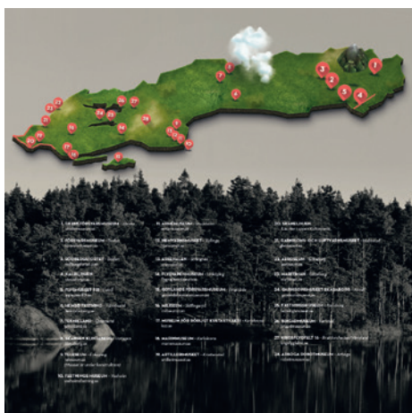
Från TIFF nr 3/2019 bytte vi kartbild till denna i artikelserien om SMHA.

Vill du veta mer om besöksmålen i Sveriges militärhistoriska arv? Kika in på www.smha.se eller SFHM:s hemsida www.sfhm.se .