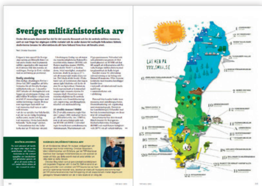
Från TIFF nr 2/2012 när denna artikelserie började.

förstå bakgrunden till aktuella händelser. SMHA-museerna berättar mycket om 1900-talets försvarsutveckling och hur försvaret påverkat hela samhället. Att på vitt skilda geografiska orter kunna möta tidigare hemligheter, anläggningar, materiel och berättelser hjälper inte minst den yngre generationen att förstå sambanden till det som händer i vår tid. Alla museerna i nätverket är dessutom väldigt olika och samtidigt mycket viktiga då de tillsammans berättar svensk militärhistoria ur så många skilda aspekter. Men inget av detta hade kunnat vara sig bevaras eller berättas utan en stor mängd entusiaster och volontärer som årligen lägger ned tusentals arbetstimmar. Med många gånger knappa resurser tar SMHA-museerna och alla som arbetar med dessa ett stort ansvar, de förvaltar dessutom en stor kunskap. Jag hoppas att engagemanget för SMHA-museerna ska fortsätta och utökas, och att många fler ska upptäcka dessa historiska ”pusselbitar”. Sveriges militärhistoriska arv ger verkliga upplevelser av försvarshistorien!” ■