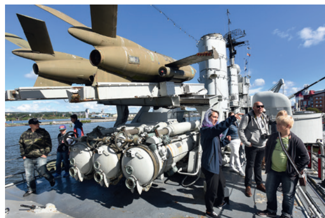
Upplev livet till havs på Maritimens museifartyg i Göteborg.