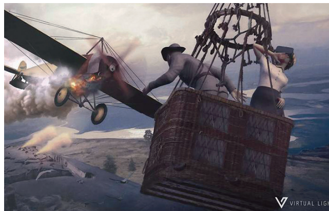
Upplev historien genom VR-teknik på Forsvarsmuseum Boden.

samlingsnamn för verksamheterna i Sveriges militärhistoriska arv, det blev SMHA-nätverket . Hos SFHM inrättades ett kansli som fick till uppgift att ansvara för bidragshanteringen och stödja nätverket på olika sätt. Bland annat har nätverksmuseerna genom åren fått stöd inom museiområden som inventering och registrering av föremål, produktion av utställningar, marknadsföring och sociala medier, och föremålsvård och bevarande. Därtill har SFHM arbetat med att informera och synliggöra SMHA för allmänheten genom bland annat marknadsföringskampanjer och deltagande på mässor och evenemang. Allt med syfte att så många som möjligt ska få tillgång till det militärhistoriska kulturarvet.