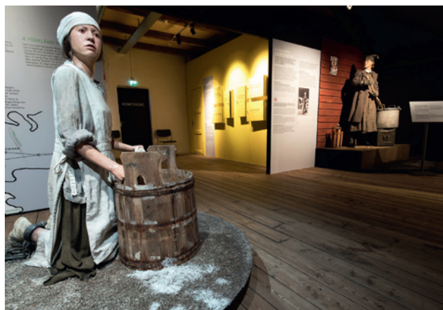
Utställningen KVINNA på Brigadmuseum, Karlstad.