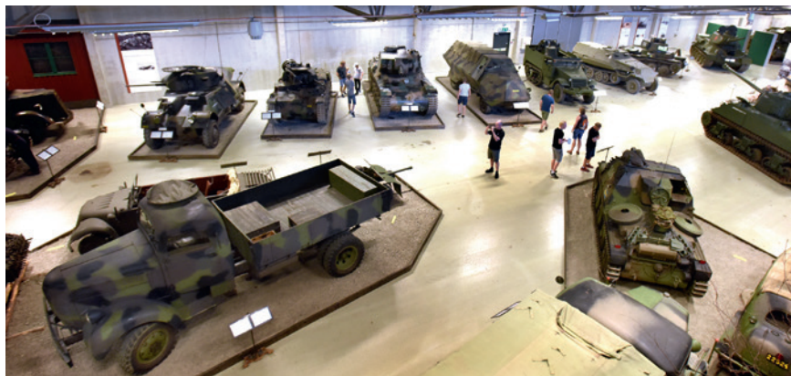
Sveriges främsta militärfordonsmuseum ingår i SMHA. Arsenalen, Strängnäs.